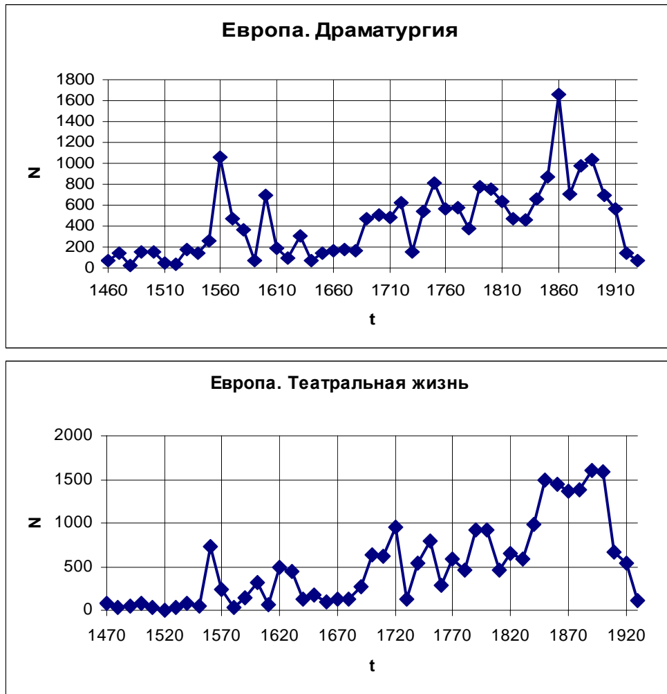
Рис. 1. Интенсивность художественного творчества: Европа, драматургия и театральная жизнь XV-XX вв.